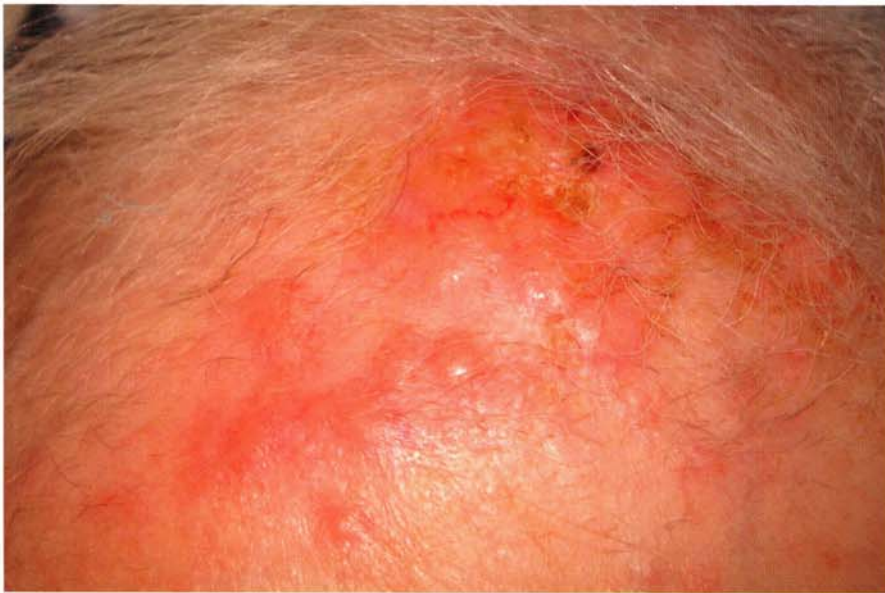
ตุ่มแดงที่หน้าผากจากการแพร่กระจายของมะเร็งปอด